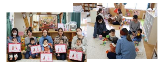
“おひなさま”の手形・足型アート